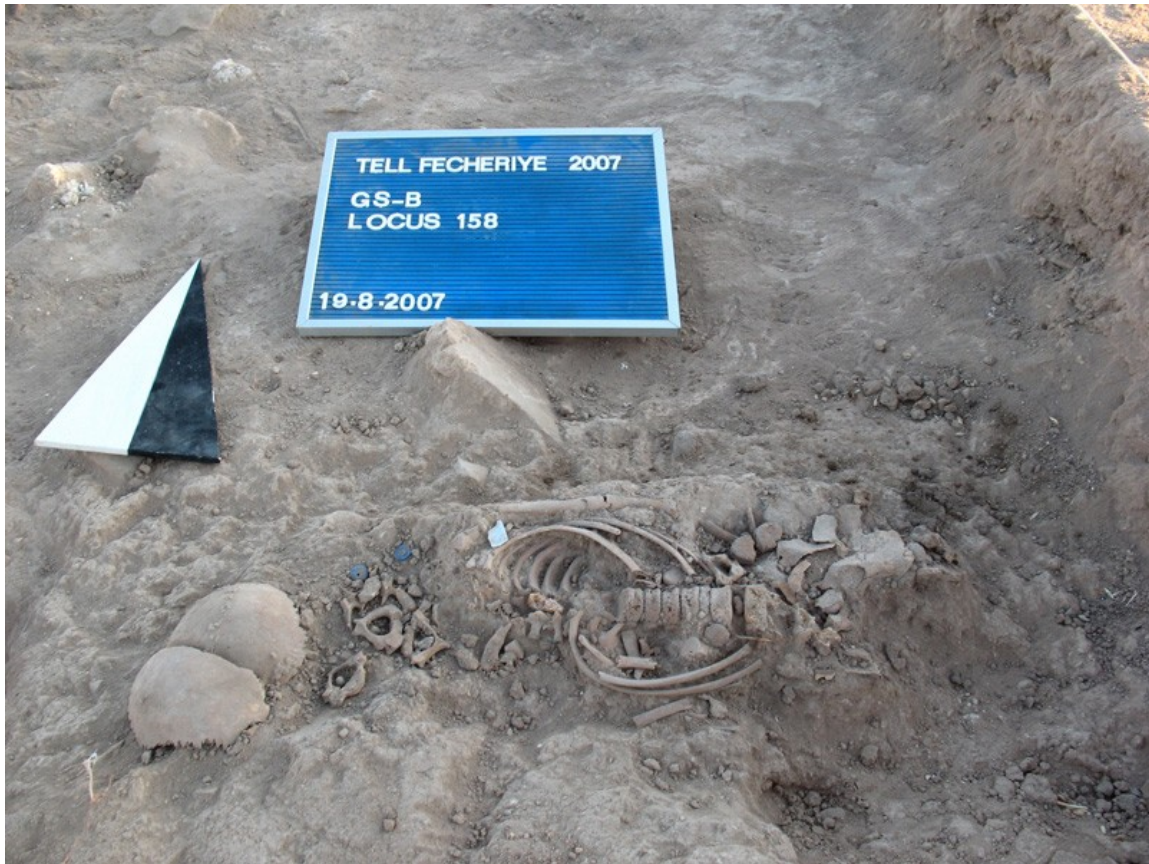
Fig. 1: 8446 مدافن أرمنية في المربع

مرحلة بناء ثانية من العصر الآشوري الوسيط تبينت من خلال سوية لأرضية ظاهرة في الجزء الشمالي من زاوية المربع 8546، أنها تقع حوالي نصف متر أعلى من الأرضية العائدة لفترة أبكر من مرحلة البناء من العصر الآشوري الوسيط وتتجه بعكس جدار ضخم من اللبن في الجزء الشمالي من المربع. الجدار يجتاز كامل المربع من الشرق إلى الغرب و كان مهدم فقط في الوسط بمرفق روماني يتكون من صفيين متوازيين من الأحجار يتجهان من الشمال إلى الجنوب. نفس الجدار كان له حفرة أساس إلى الجنوب مما يدل على أن الجدار يقطع الجدار الشرقي لمرحلة البناء الأولى من العصر الآشوري الوسيط