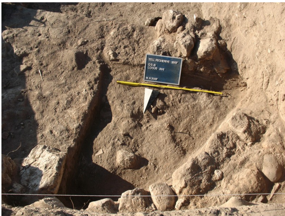
Fig. 3: 8446 محراب روماني في المربع 8446