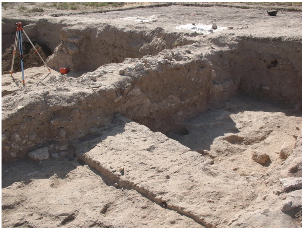
Fig. 2: 8446 في الجزء الغربي من المبنى البيزنطي، المربع 8446.