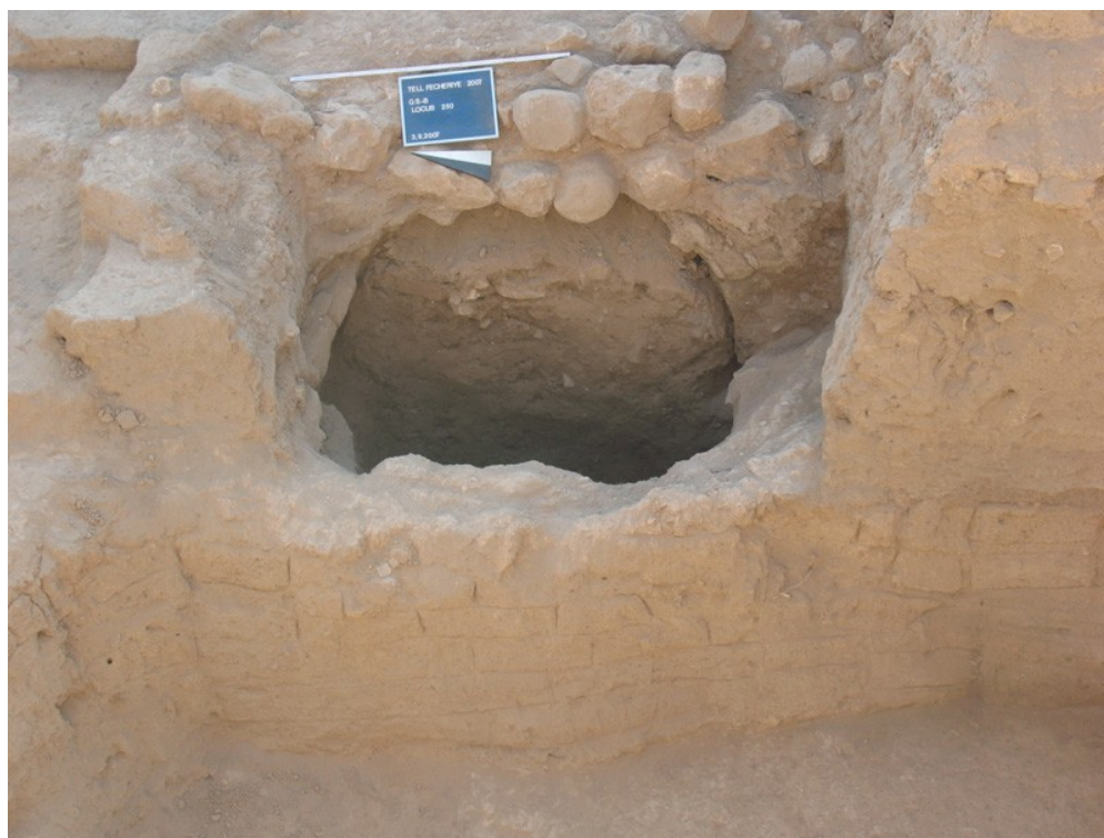
تشبيد روماني مقوس يقطع الجدران من العصر الآشوري الوسيط في المربع 8546 Fig. 5: